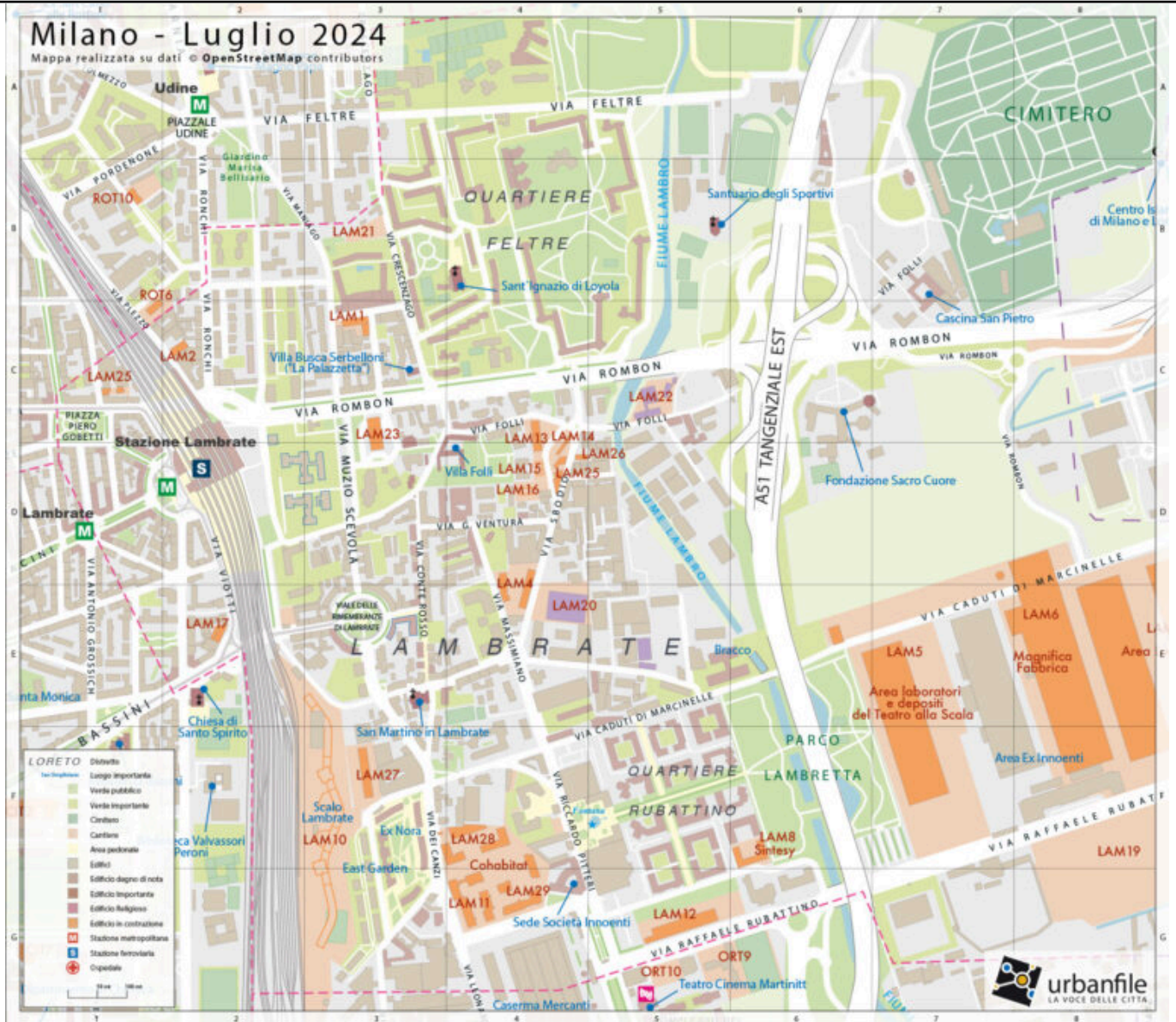
Mercato coperto via Rombon LAM23: C3